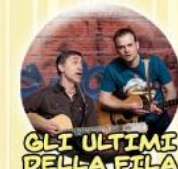
GLI ULTIMI DELLA FILA