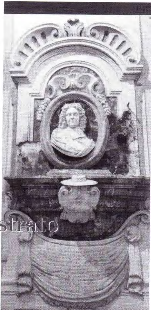
Cenotafio di Atto Melani, Chiesa di San Domenico